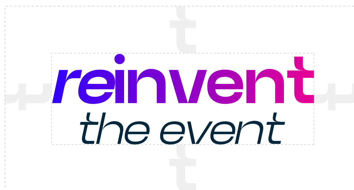
Versão principal vertical Dimensão mínima - 150 px Apenas quando o tamanho do logótipo não permite a visibilidade adequada